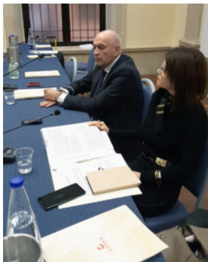
tavolo della presidenza