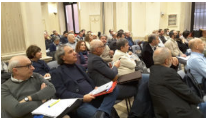
foto di sala