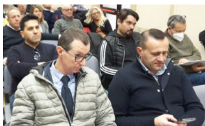
foto di sala