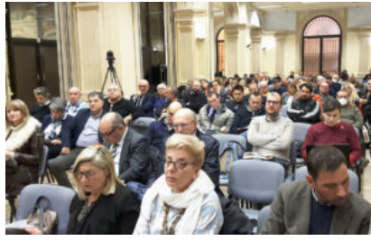
foto di sala