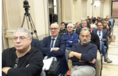
foto di sala