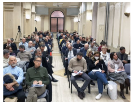
foto di sala