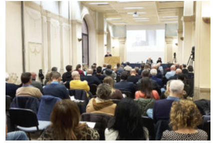
foto di sala