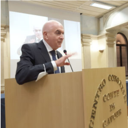
Saluto del Segretario Generale