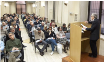
foto di sala