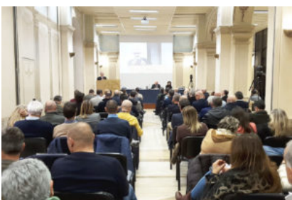
foto di sala