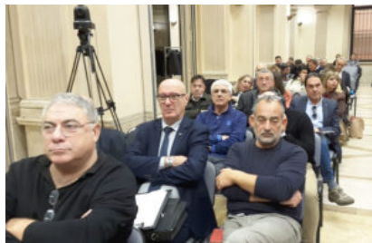
foto di sala