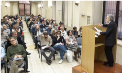
foto di sala