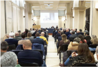
foto di sala