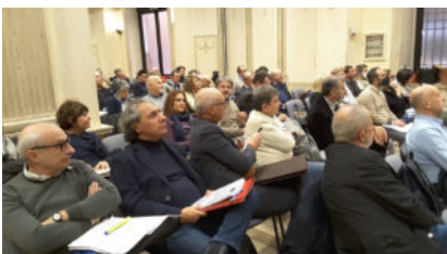
foto di sala