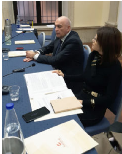
tavolo della presidenza