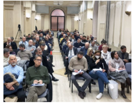
foto di sala