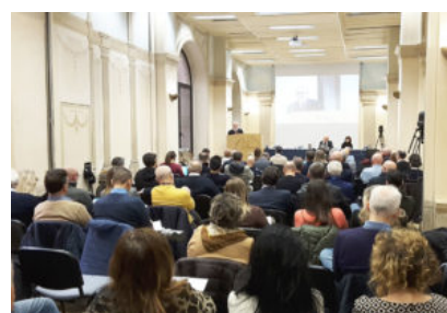
foto di sala