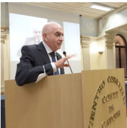
Saluto del Segretario Generale