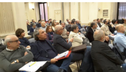
foto di sala