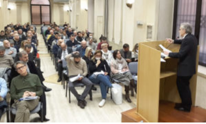
foto di sala