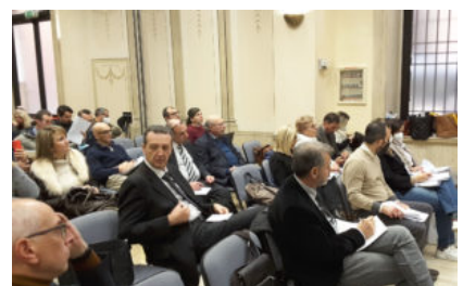
foto di sala