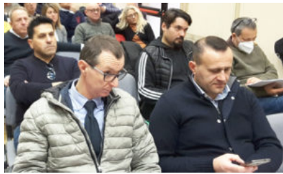
foto di sala