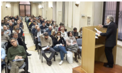
foto di sala